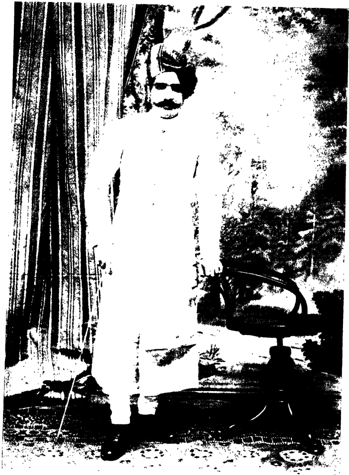
श्री० राजा अजीतसिंहजी बहादुर, खेतड़ी